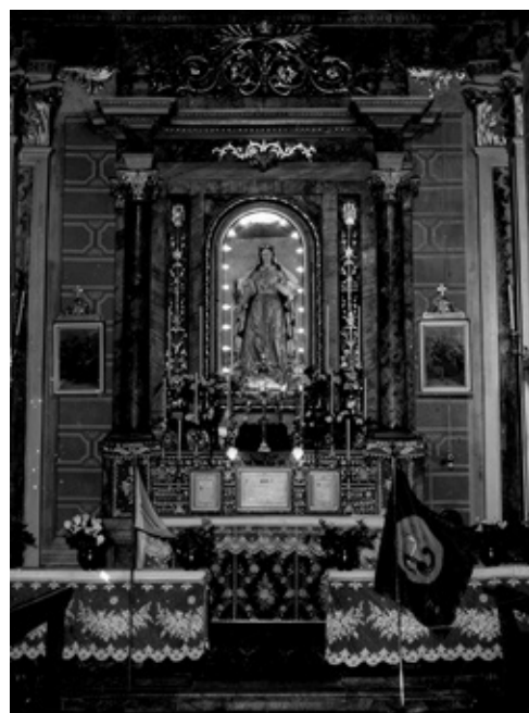
Ricordo trentatreesimo cinquantenario del Martirio S. Agnese V.M. Moghegno 24 . I . 1954

Il consueto banco del dolce, al termine della messa, permette di far fronte, almeno parzialmente, ai costi per l'acquisto di piante e fiori. Il Consiglio parrocchiale ringrazia le persone che hanno offerto le torte e per la generosità delle donazioni.