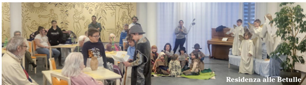
Residenza alle Betulle